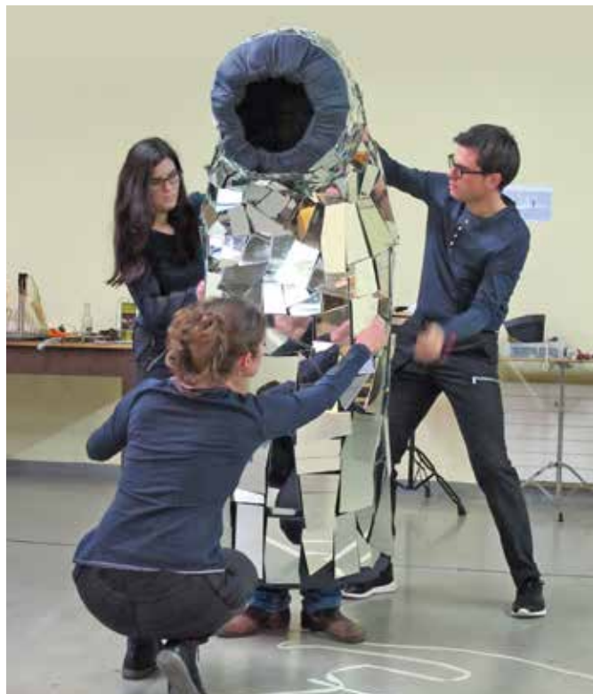
Le costume «All eyes on me» symbolise l'armure virtuelle dont se parent les mercenaires modernes.