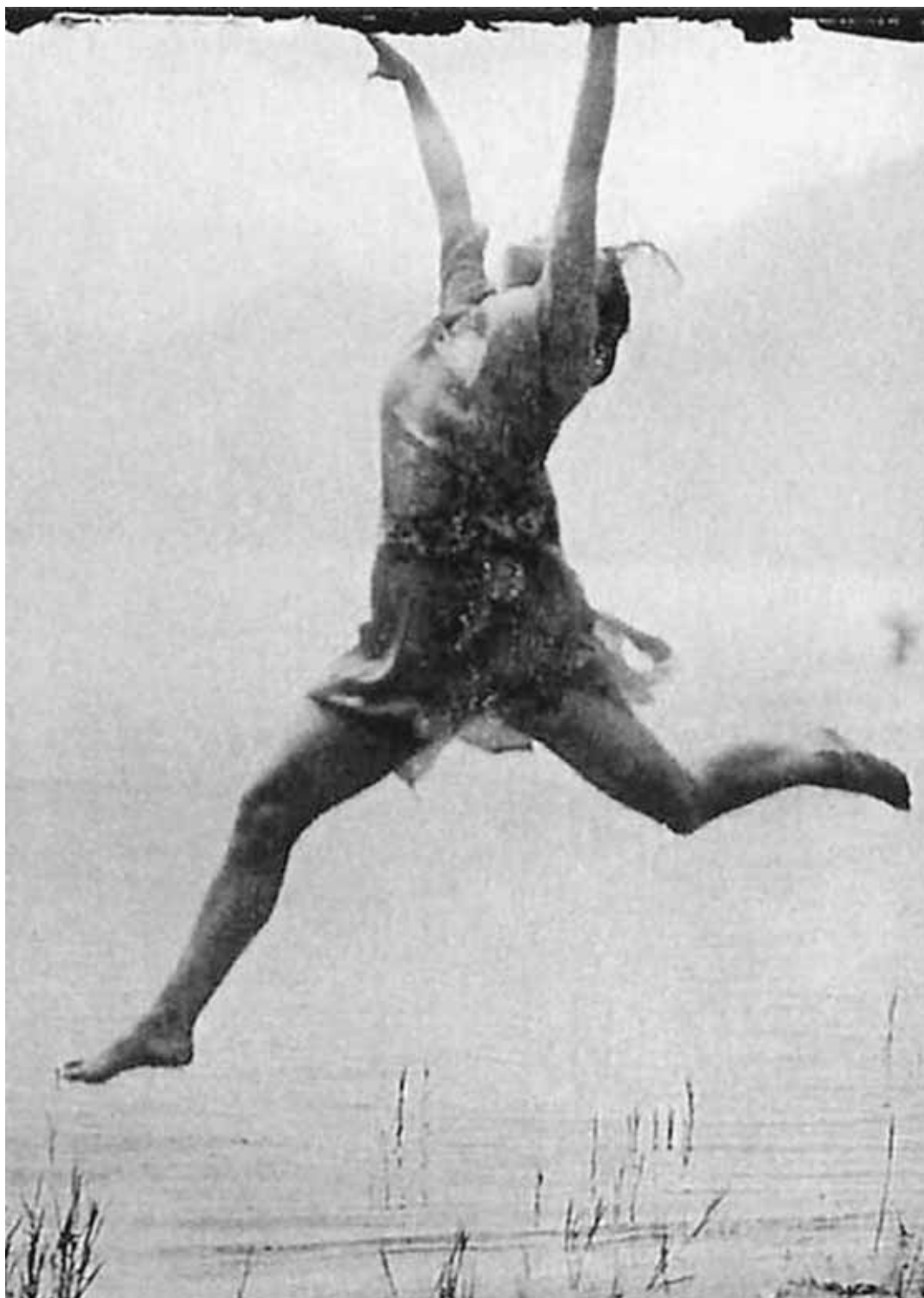
Le Forum Mont-Noble participe au programme Viavai avec un spectacle intitulé «Peut-on être révolutionnaire et aimer les fleurs?». A découvrir samedi soir. ALAIN ROCHE

Initiative de Pro Helvetia, la réalisation de cette collaboration binationale vise à favori-