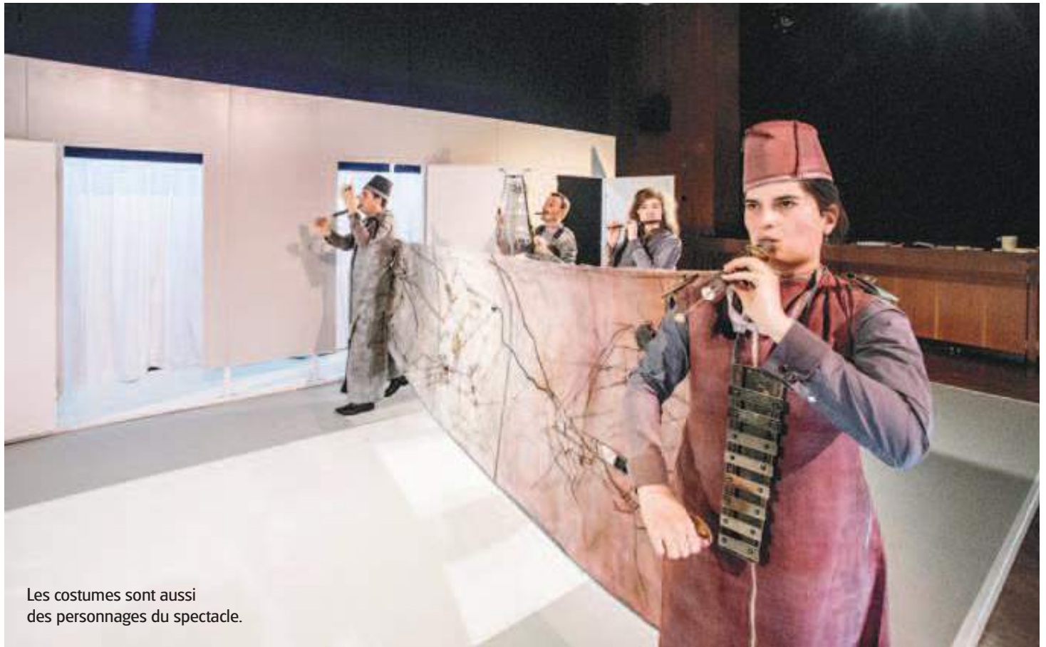
Les costumes sont aussi des personnages du spectacle.

Le spectacle, créé dans le cadre de Viavai (échanges culturels entre la Lombardie et la Suisse) a réuni dans un premier temps des binômes de créateurs et de musiciens suisses et italiens. Il est ressorti de cette collaboration onze costumes associés à onze pièces musicales, qui composent les tableaux à découvrir sur la scène montheyenne. «Le spectacle ne raconte pas une histoire, précise