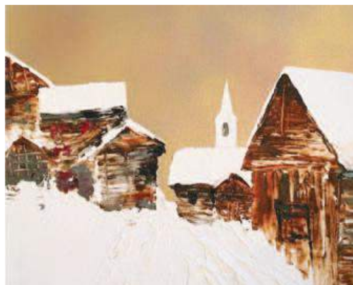
Des quartiers de village sous la neige. Toute une atmosphère. LDD

«Hiver Rudin», vernissage le 20 décembre à partir de 17 h, Vercorin, galerie Minuscule.