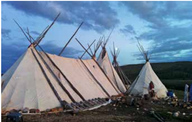
Traditionelle Zelte eines indigenen Stammes von Quebec.

die Ureinwohner Quebecs wussten. Wir konnten nicht einmal alle Stämme aufzählen.»