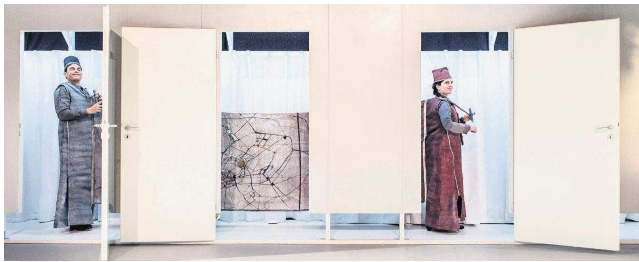
Au fil de la représentation, les musiciens performers du Klangbox Ensemble égrènent les instruments et varient les costumes pour livrer leur vision de Marignan.